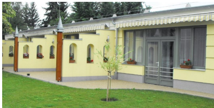
A Lajosmizsei Meserét Óvoda bővítése a GOMÉP Kft. kivitelezésében 2013-ban