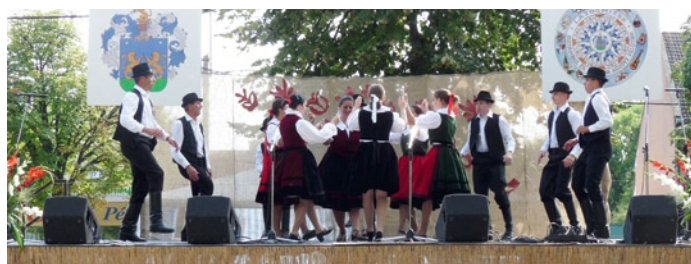
A magyarremetei néptáncsoport fellépései sok Lajosmizsei Napok programját színesítették