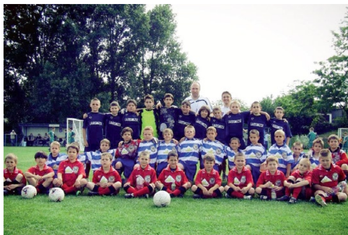
Ígéretes gyermek labdarúgóink