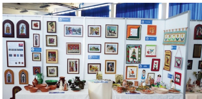
Városunk gazdag kézművességét bemutató kiállítási stand a tavalyi kiállításon