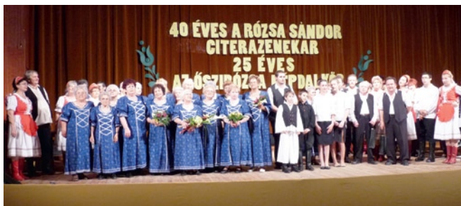
Színpadon az aktív népzeneészek és a már nem aktív, de hívószóra örömből bármikor táncoló néptáncosok csapata