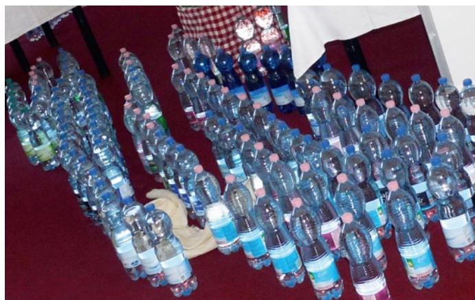
A Magyarvíz Kft. tavalyi kiállítási standja